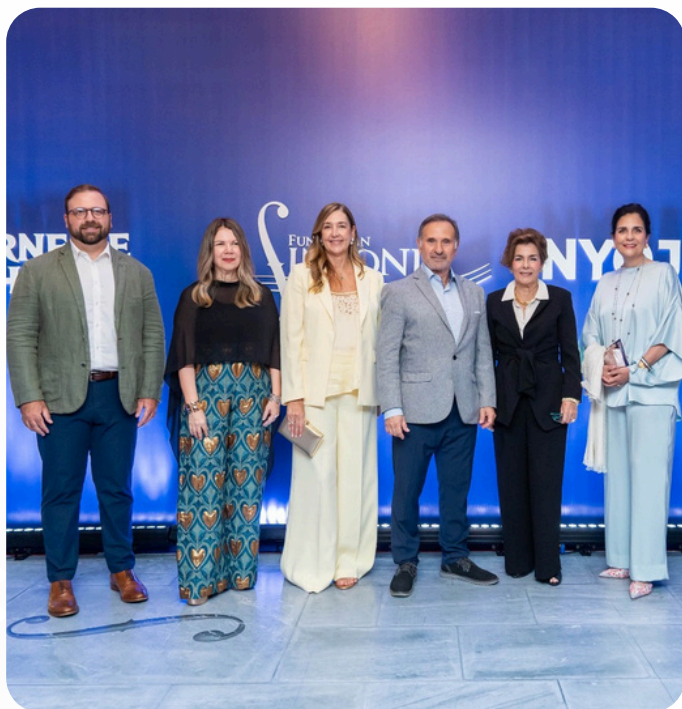
Evento: Concierto NYO Jazz de Carnegie Hall, Fundación Sinfonía.