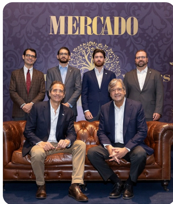
Evento: Family Values, Revista Mercado.